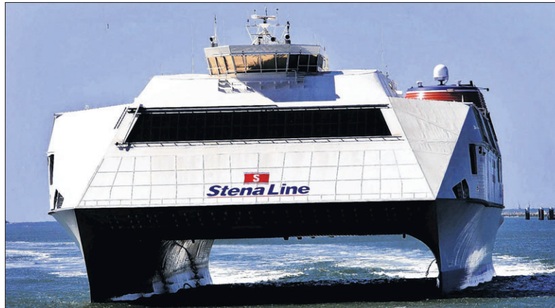
De HSS Discovery voor de Nederlandse kust.